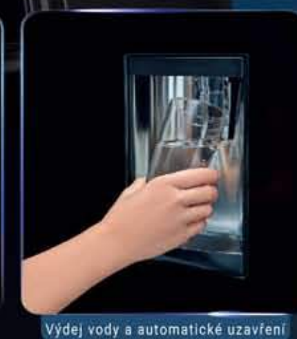
Výdej vody a automatické uzavření